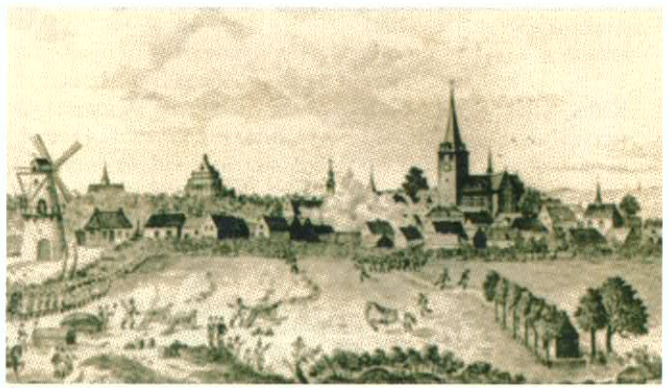
Turnhout tijdens de Slag van 1789 (Museum Taxandria, Turnhout)

lijn, gaande van het Vianen tot aan den Bausen Pad (Diksmuidestraat) op de stad aanrukten, om deze van verschillende zijden binnen te vallen, schijnen zich ten gevolge van de heersende mist, in de richting te hebben vergist. Hun colonnes bereikten niet afzonderlijk het bewoonde centrum, doch liepen samen in de smalle Gasthuisstraat. Vooral de troepen die langs de Baus opdrongen begingen verschillende wreedheden tegen de burgers. In de Gasthuisstraat werden de Oostenrijkers zeer "warm" onthaald zodat zij slechts uiterst langzaam naar de Markt vermochten door te dringen. Tweemaal slaagden de patriotten er zelfs in een kanon te overmeesteren. Tenslotte kon Generaal van der Mersch zelf tot de aanval overgaan, toen zijn reserves, die achter de kerkhofmuur van Sint-Pieter waren opgesteld, de vijand langs verschillende zijstraten in de flank gingen bestoken. Rond elf uur gaf Generaal