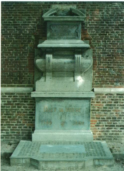
Herdenkingsmonument 100ste verjaardag

andere getallen. Al stonden enkele weken later Schroeder en andere opnieuw in Turnhout, dit eerste succes had een weerklank in de rebellerende middens van heel het land. De rebellie werd dus met succes bekroond. Na Turnhout bevrijdden de opstandelingen een hele reeks steden in de Oostenrijkse Nederlanden. Op 11 januari 1790 riepen ze de Republiek van de Verenigde Nederlandse Staten uit. Bij de opstand hadden de twee fronten (progressieven onder leiding van Vonck en Verlooy, en conservatieven onder Van der Noot en Van Eupen) elkaar gevonden. Doch later wonden de conservatieven het pleit. Van de progressieven was nauwelijks sprake, dit in tegenstelling tot bijvoorbeeld de Franse Revolutie. Het Oostenrijkse juk was afgeworpen maar lang zou de nieuw verworven vrijheid niet duren. In die zin was de Brabantse Omwenteling een conservatief gebeuren. De patriotten hoopten op internationale erkenning en steun. Die kwam er echter niet. De nieuwe Oostenrijkse keizer, Leopold II, zette de tegenaanval in.