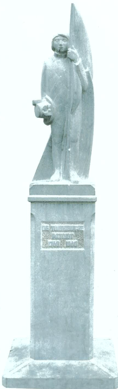
Herdenkingsmonument 200ste verjaardag

Voor bejaarden en minder-validen is er elke avond een gratis pendeldienst naar de negen locaties. Vertrek: station N.M.B.S. te 20 u. Te 24 u. vertrek van de Markt naar het station.