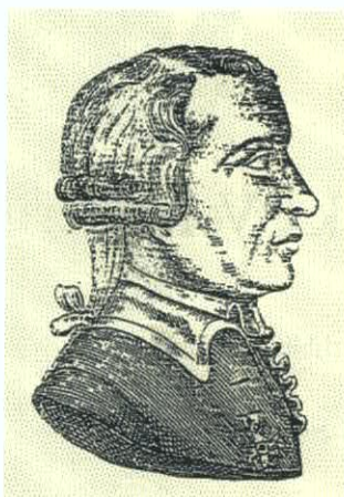
Generaal van der Mersch, rugzijde van een speelkaart

18 december 1789 onder leiding van Van der Noot in deze stad, was een voorlopig eindpunt van circa twee maanden strijd, waarvan de Slag van Turnhout een der grootste episodes was. Omdat Jozef II geen rekening hield met de Blijde Intrede , de grondwet van Brabant, stond het volk op tegen deze gekroonde hervormer. Men schaarde zich onder de driekleurige vlag (rood-geel-zwart). Vermits de opstand te Leuven en Brussel begon en Brabant de belangrijkste provincie van de Zuidelijke Nederlanden was, waar het gouvernement zetelde, noemde men de vrijheidsbeweging, de Brabantse Omwenteling. Gaandeweg was in onze gewesten een algemeen ver-